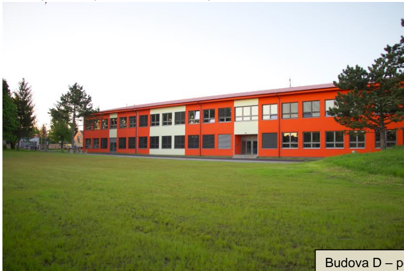
Budova D – pohled z ulice V Aleji

Nový pavilon D byl dokončen na začátku srpna 2020, úspěšně zkolaudován a předán zřizovateli do užívání. Nová budova D vznikla na místě původního objektu, kde dříve byla jídelna, šatny a kuchyně. Slavnostně byla otevřena 3. 9. 2020.