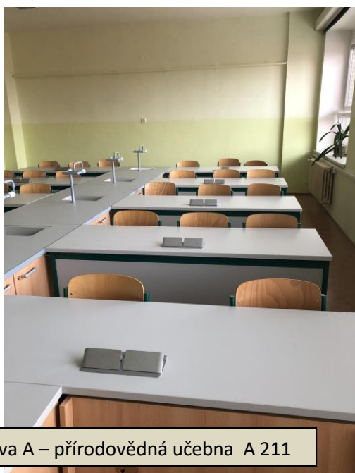
Budova A – přírodovědná učebna A 211

Díky spolufinancování fondů EU (Projekt Modernizace přírodovědných učeben v ZŠ Rudná CZ.06.4.59/0.0/0.0/16_075/0011239) se podařilo vybudovat novou odbornou učebnu přírodopisu a chemie, kde se v tomto školním roce vyučovali žáci I. stupně, kteří mohli chodit do školy prezenčně, a na konci školního roku v učebnách poprvé pracovali žáci 8. a 9. ročníku.