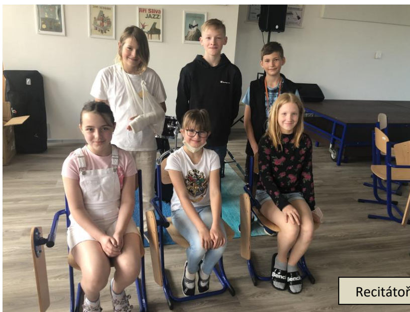
Recitátoři v čase „corony“