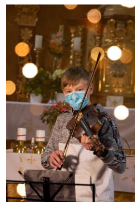
Noc kostelů 2021

duben Školní výtvarně sportovní soutěž – Kreslí pohybem!