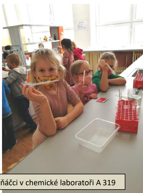
Prvňáčci v chemické laboratoři A 319