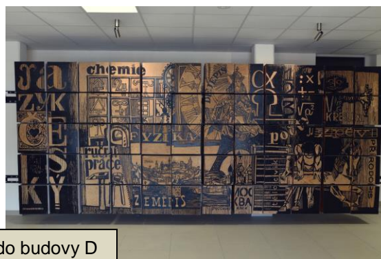
Zrenovovaný reliéf – vstup do budovy D