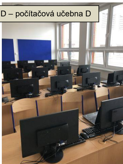
Budova D – počítačová učebna D

Škola se tak rozrostla o osm kmenových tříd, sedm kabinetů pro učitele, prostornou sborovnu, moderní hudebnu, knihovnu, kanceláře ředitelství, zasedací místnost, ale i o dílnu pro školníka. Všechny prostory byly vybaveny novým nábytkem.