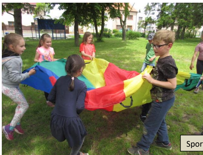
Sportovní odpoledne v rámci Dne dětí