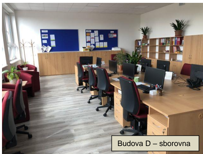
Budova D – sborovna