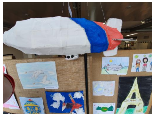
Z výstavy prací žáků – okna školní jídelny