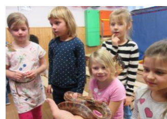
Penthea – Smysly živočichů