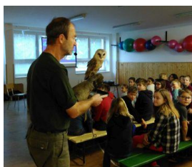
Penthea – Smysly živočichů