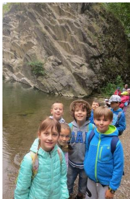
Prokopské údolí – 2. ročník