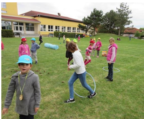
Zábavné odpoledne – vítání prvňáčků

Družina pro svou každodenní činnost využívala bohaté sportovní zázemí školy, školní zahradu s herními prvky, vnitřní malou tělocvičnu a školní cvičnou kuchyňku. Mnoho aktivit školní družiny směřovalo k rozvíjení osobnosti a budování sociálních kompetencí jednotlivých žáků. K tomuto rozvoji přispělo společné plnění zadaných úkolů, společné hry, kde šlo zejména o rozvoj vzájemné spolupráce, o udržování a rozvoj kamarádských vztahů mezi dětmi, vzájemnou pomoc. Společné aktivity přinášely nejen nové poznatky, ale i návyky správného chování. Toto pozitivní usměrňování vedlo také k prevenci sociálně patologických jevů. Činnost družiny nebyla vždy jen kolektivní, ale dle svých možností ukazovala a pomáhala jednotlivým žákům s orientací dosud nepoznaných oborů a snažila se tím tak vzbuzovat jejich zájem. Takové možnosti poskytovaly všechny akce školní družiny, které se konaly nejen ve škole, ale i mimo její areál, viz níže.