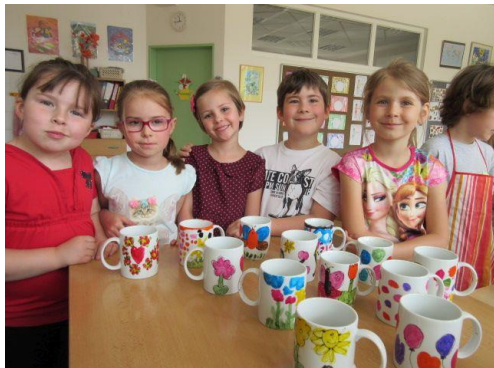
Dílnička – malování hrnečků, výroba připínací placky