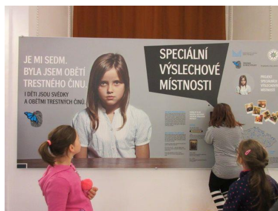
Muzeum policie ČR – 3. ročník