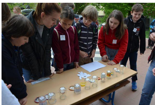
Den Země 2. – 9. ročník

Z široké nabídky environmentálních programů a pořadů si vyučující mohli vybírat prostřednictvím informačních materiálů na nástěnce ve sborovně a vedle učebny přírodopisu, popř. samostatně prostřednictvím nabídek na internetu apod.