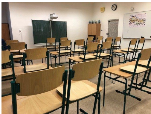
Nová učebna II. stupně - budova A, 1. patro

K tomu, aby mohla být ve škole zajištěna výuka žáků ve školním roce 2018 - 2019, došlo v průběhu hlavních prázdnin školního roku 2017 - 2018 k dalším poměrně rozsáhlým úpravám následujících prostor: jazyková učebna v budově A v prvním patře byla zrušena, kancelář školy přestěhována do stávající kanceláře ředitele školy a na jejich místech vybudována potřebná kmenová třída pro II. stupeň. Kancelář ředitele školy byla přemístěna do stávající místnosti se školními servery. Další nová třída druhého stupně vznikla přebudováním prostoru šaten I. stupně. Stávající i nově zakoupené šatní skříňky byly umístěny do prostoru chodby v přízemí budovy A (24 trojskříňí).