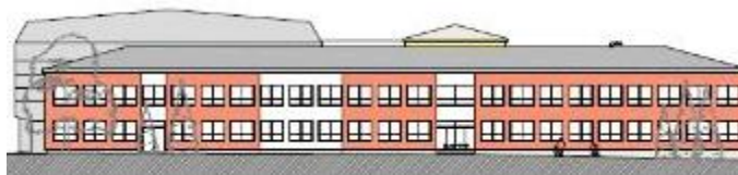
Studie: nová budova (stávající šatny a školní jídelna)

K tomu, aby mohla být ve škole zajištěna výuka žáků ve školním roce 2018 - 2019, došlo v průběhu hlavních prázdnin školního roku 2017 - 2018 k dalším poměrně rozsáhlým úpravám následujících prostor: jazyková učebna v budově A v prvním patře byla zrušena, kancelář školy přestěhována do stávající kanceláře ředitele školy a na jejich místech vybudována potřebná kmenová třída pro II. stupeň. Kancelář ředitele školy byla přemístěna do stávající místnosti se školními servery. Další nová třída druhého stupně vznikla přebudováním prostoru šaten I. stupně. Stávající i nově zakoupené šatní skříňky byly umístěny do prostoru chodby v přízemí budovy A (24 trojskříňí).