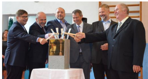
Poklepání základního kamene