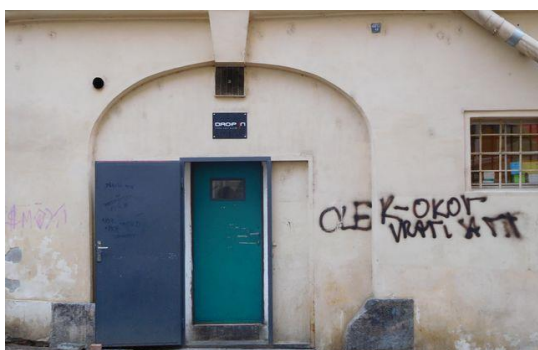
Drop in – 8. ročník