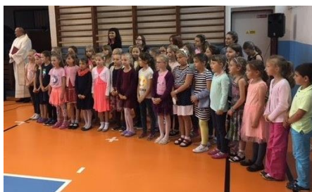
Účast školního sbor Taktus na slavnostním aktu