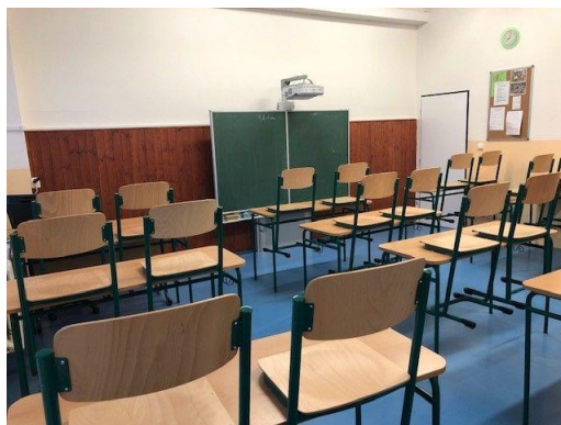
Nová učebna II. stupně - budova A - přízemí