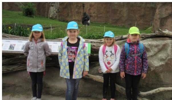
ZOO Praha – 1. ročník