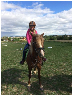
Na farmě u Bauerů – 3. D