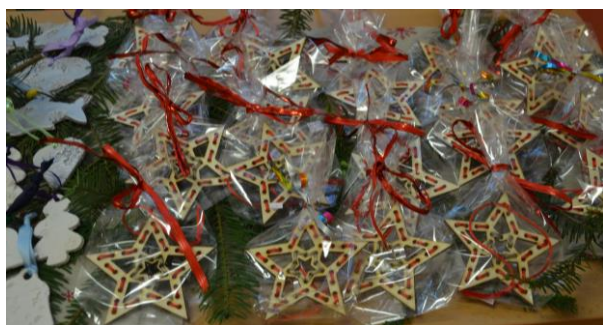
Příprava na vánoční punč 1. – 9. ročník