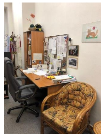
Kancelář ředitele školy