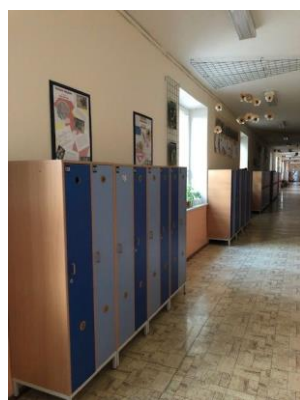
Šatní skříňky – budova A - přízemí

Nedostačující jsou stále samostatné prostory pro školní družinu. Ráno i po skončení výuky využívá školní družina ke své činnosti kmenové učebny v pavilónu B a C. Zajištění chodu školní družiny je velmi organizačně náročné, avšak kvalita výchovné práce tímto stavem není dotčena.