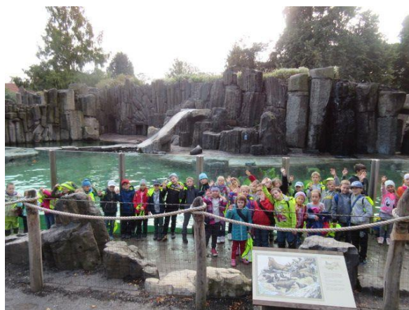
Návštěva ZOO Praha