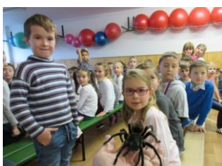
Penthea – Smysly živočichů