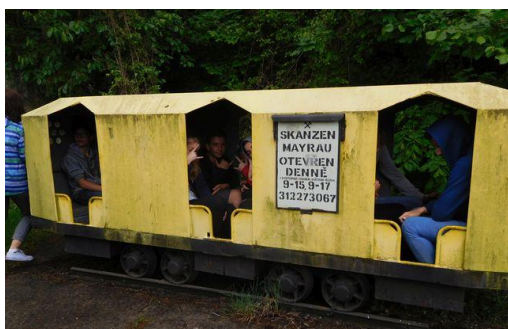
Skansen MAYRAU – 9. ročník