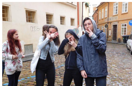
Drop in – 8. ročník