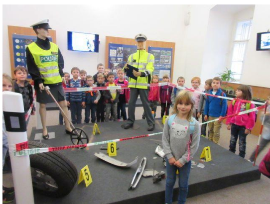
Muzeum policie ČR – 1. ročník

Ve školním roce 2017 - 2018 jsme se zabývali řešením devíti případů fyzického a psychického ubližování mezi žáky, jedním případem, kdy k takovému jednání bylo zneužito el. zařízení, dvěma případy záškoláctví, pěti případy skrytého záškoláctví, jedním případem zanedbávání dítěte a třemi případy užívání cigaret na půdě školy. Pokračovali jsme také ve spolupráci s Proximou Sociale v cílené intervenci v jedné ze tříd druhého stupně, kde docházelo mezi žáky ke konfliktům.