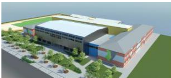
3D model finální podoby školy

Dokončení a otevření se předpokládá v roce 2020.